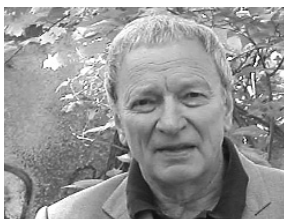
Uwe Timm

„Damit hatte er nicht rechnen können, ausgerechnet hier, am Mare Balticum, von seinem Vorleben eingeholt zu werden.“ Uwe Timm erzählt in seiner Novelle „Freitisch“ vom späten Wiedersehen zweier Männer, die in den frühen Sechzigern, noch vor dem großen Aufbruch, als Studenten in München ihren Weg suchten. Am Freitisch saßen sie mittags beieinander, in der Kantine einer spendablen Versicherung, und ihre Gespräche kreisten um Gott und die Welt und einen gemeinsamen Bezugspunkt: Arno Schmidt. Als sie sich in Anklam wiedertreffen, prallen zwei Lebensentwürfe aufeinander.