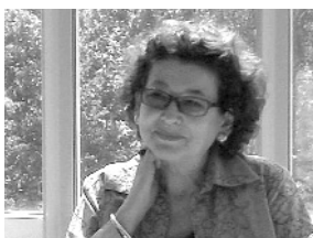
Marianne Hofmann © lichtung verlag

„Es glühen die Menschen, die Pferde, das Heu“ lautet der Titel von Marianne Hofmanns Roman, der erstmals 1997 im Insel Verlag und 2011 in einer Neuauflage in der Reihe Kuckuck Straps im lichtung verlag erschien. Die Autorin erzählt darin in unverwechselbarem poetischen Ton von Licht und Schatten einer Kindheit, deren Mittelpunkt das elterliche Dorfwirtshaus in der Holledau bildet.